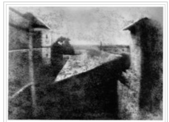
Le premier résultat d'une expérience de Joseph Nicéphore Niépce.

Joseph Nicéphore Niépce, un inventeur de Chalon-sur-Saône, associe ces trois procédés pour fixer des images (de qualité moyenne) sur des plaques d'étain recouvertes de bitume de Judée, sorte de goudron naturel qui possède la propriété de durcir à la lumière (1826 ou 1827) : la première photographie représente une aile de sa propriété à Saint-Loup-de-Varennes (Saône-et-Loire). Si on regarde bien cette image, on remarque son éclairage particulier. En effet, la pose a duré plusieurs heures. Le soleil a éclairé le mur de droite puis celui de gauche plus tard dans la journée.