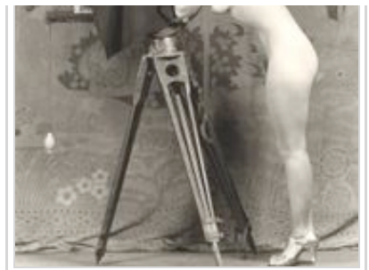
Woman with camera. Photo: Alfred Cheney Johnston, c. 1920.

Mais la réalisation de la photographie s'est également rapidement diffusée. Et aujourd'hui, presque tout le monde a facilement accès à la capacité de « prendre une photo ». La représentation du monde en a été transformée et les sociologues ne manquent pas d'étudier les pratiques et les résultats de cette photographie populaire. Pensons seulement aux touristes japonais, l'appareil photographique toujours en bandoulière, ou à nos boîtes à chaussures pleines de vieilles photographies de famille.