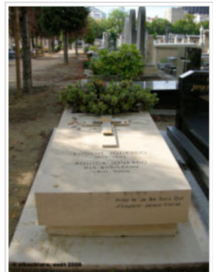
Tombe d'Eugène Ionesco au Cimetière du Montparnasse

Quand il meurt à Paris, à l'âge de 84 ans, pour être enterré au Cimetière du Montparnasse, il est non seulement roi sans couronne du théâtre de l'absurde, mais il est aussi considéré comme l'un des grands dramaturges français du vingtième siècle.